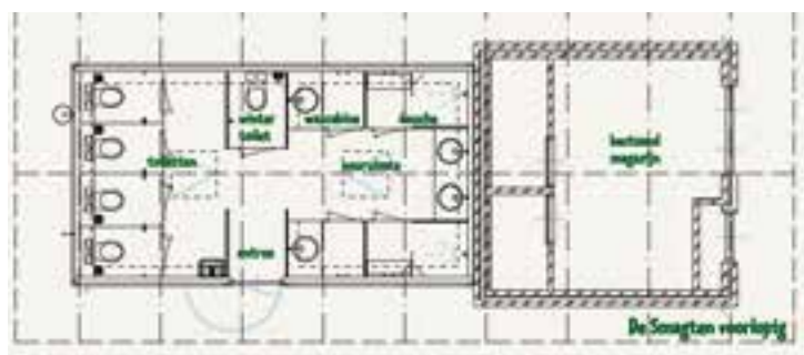
De Smagten voorzijde